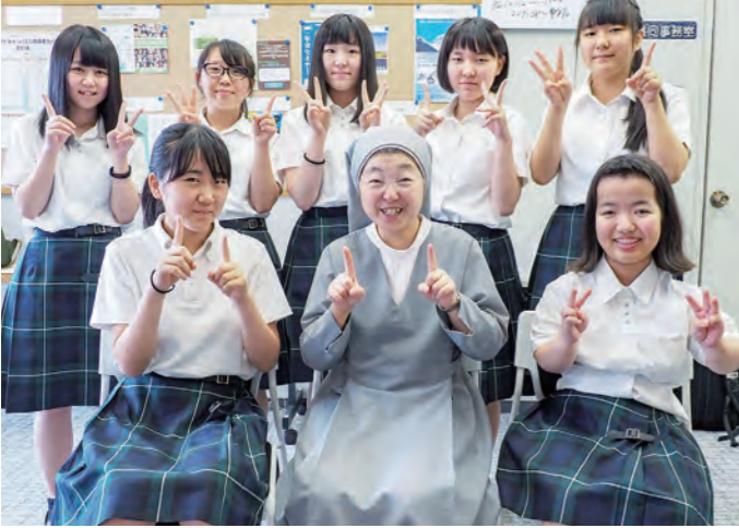
いちいち指で「1・2・3」のポーズをとりました

1997年「家族シネマ」で20代若き若き芥川賞を受賞した、作家の柳美里さん。その後もベストセラーを次々と発表し、7年前の東日本大震災以降は、祖父や母の死をテーマにした小説を次々と発表してきた。このほど、南相馬市の小高区に転居して、自宅を兼ねた書店を開業した。JR小高駅から徒歩3分ほどにある書店「フルハウス」は、一般的な書店と違って、前には本屋がなくて、お茶を飲める。店内は、お茶を飲める。店内は、お茶を飲める。店内は、お茶を飲める。