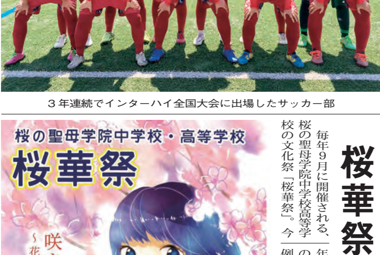
3年連続でインターハイ全国大会に出場したサッカー部

放送部もNHK杯全国大会に 高校放送部の頂点を競うNHK杯高校放送コンテスト全国大会にも、本校は3年以上毎年出場している。