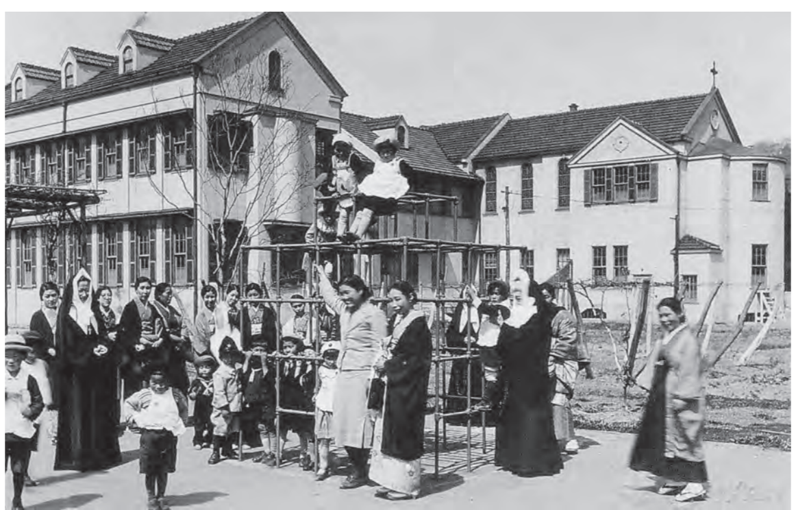
1938(昭和13)年、雛菊幼稚園開園時の貴重な写真

80周年記念特集 2面 ●被災地浜通りへ 3面 ●柳美里さんの書店 ひふみん次女はスター 4面 ●筑波大学見学記 選択修学旅行始まる