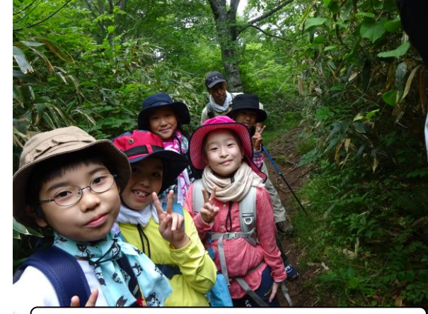
鬼面山登山7合目 あとひと踏ん張りです!

合宿デビューとなる「4年登山合宿訓練」が、7月22日～23日に行なわれました。今年の4年生も、1学期から高学年に交じってマラソンに励み、体力面の準備を積んできました。また、今年度は、6年生が4年生に向けて「登山合宿訓練プレゼンテーション」を実施してくれました。そのおかげで、4年生も具体的なイメージを持って臨むことができました。