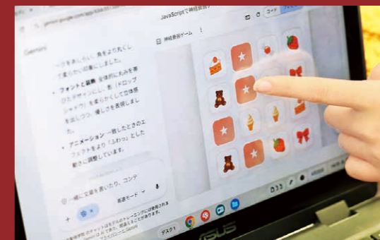
生徒がAIで作成したゲーム

これからの社会は生成AIが生活や仕事の一部となっていきます。本校での学びを通して、ツールとしてのAI活用だけでなく、「AIと協調して新たな価値を生み出す力」を育むこともできたらと考えています。是非、一緒に学びましょう。