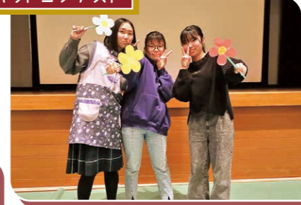
スキットコンテスト

自分たちでシナリオから劇まで創作する英語劇で、舞台セットや衣装まで考えて発表します。