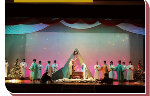
クリスマスのつどい