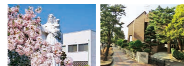
マルガリタ幼稚園(東京都調布市) 明治学園(福岡県北九州市)