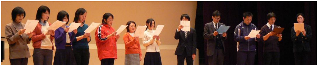
「We Three Kings Of Orient Are」 （われら三人は東方の王） ♪