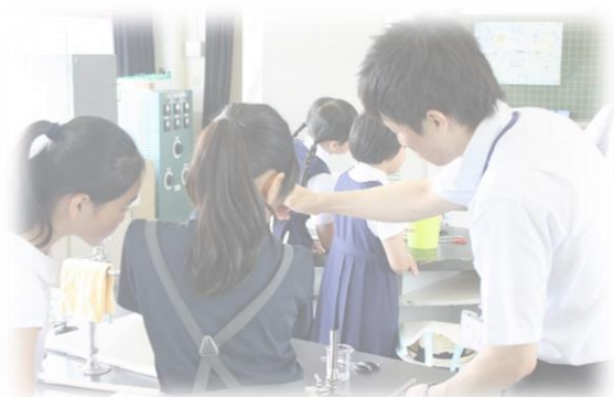
7月のオープンスケールの様子